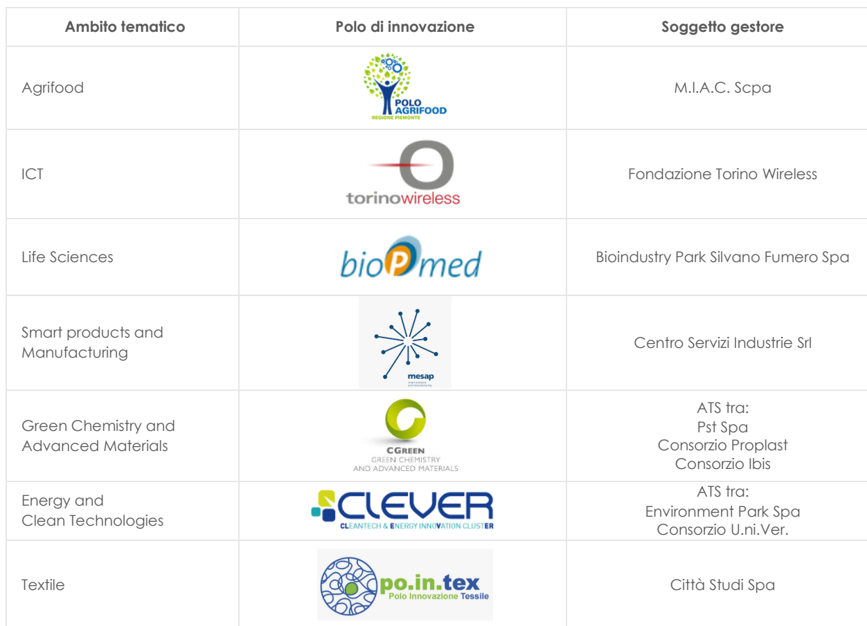
Tavola 1 – Ambiti tematici, Poli di innovazione e soggetti gestori (2014/2020)